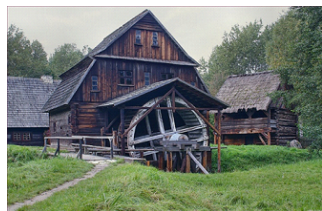
VII. MŁYN WODNY W SIÓŁKOWICACH STARYCH - OPOLE