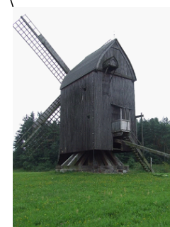
IV. WIATRAK W OLSZTYNKU