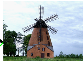
VIII. WIATRAK STARA RÓŻANKA POWIAT KĘTRZYŃSKI