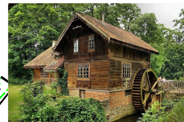
I. MŁYN WODNY W CIECHANOWIE