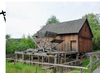
IX. MŁYN WODNY W NOWOGRODZIE