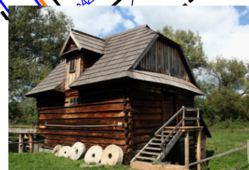
III. MŁYN WODNY ŻOŁYŃ