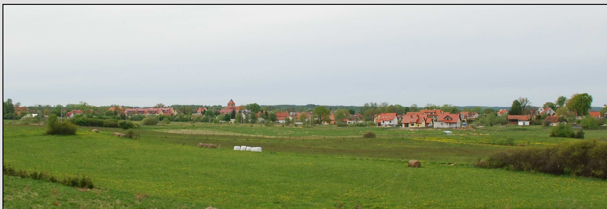
Fot. Widok na miasto lokacyjne od południa

Główną dominantą przestrzenną jest gotycki kościół zlokalizowany w północno – zachodnim kwartale miasta lokacyjnego, a jego wieża widoczna z daleka zwieńcza charakterystyczną sylwetę lokacyjnego miasta.