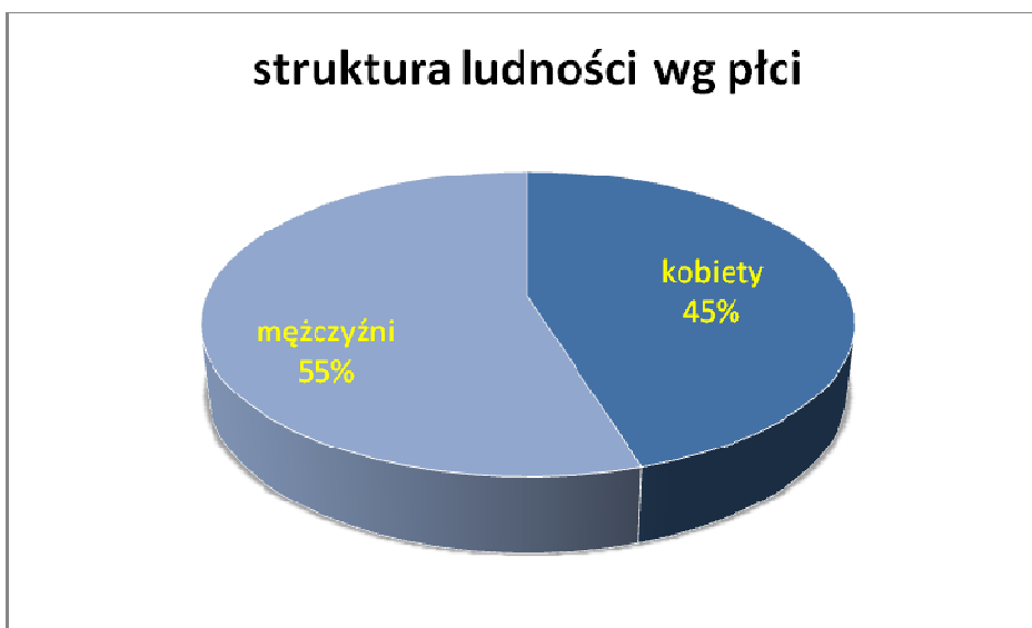
Wykr.2 struktura ludności wg płci