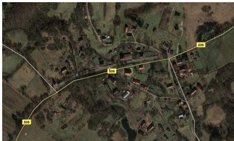
Rys. 2 Układ zabudowy w Zastawnie

Układ zabudowy wiejskiej nosi cechy historycznego kształtowania się osadnictwa. Zastawno jest wsią należącą do typu wielodrożne, lokowaną na miejscu osady pruskiej.