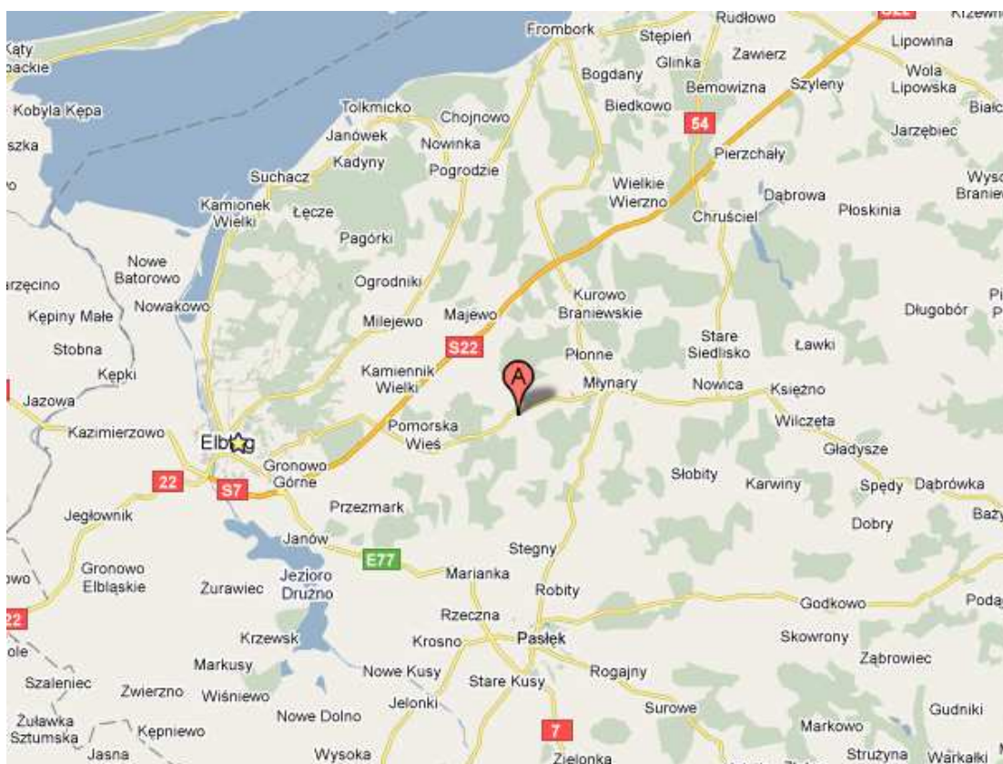
Rys 1. Położenie miejscowości Zastawno (pkt A – Zastawno)

Miejscowość Zastawno położona jest w gminie Młynary w północno – zachodnim krańcu województwa warmińsko – mazurskiego, w powiecie elbląskim, na wschód od Elbląga (w odległości ok. 20km) oraz na południowy wschód od Zalewu Wiślanego.