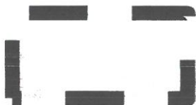
granice obszaru objętego zmianą