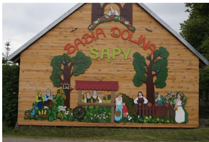
Rys. nr 5. Panoramiczny witacz wsi tematycznej Sapy „Babia Dolina”

Charakterystycznymi elementami naszej miejscowości są witacze - drewniane rzeźby Bab witające przyjezdnych. Największy z nich to panoramiczny witacz Wioski tematycznej Sapy Babia Dolina o powierzchni około 40m 2 , a także płaskorzeźby baby z numerami domów, zwyczajowe nazwy ulic.