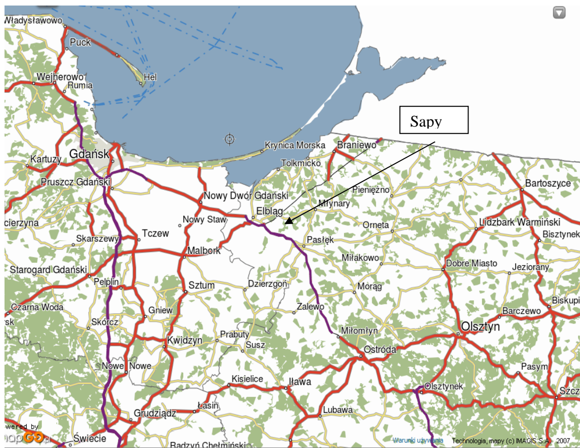
Rys. nr 1 Położenie miejscowości Sapy..

Wieś Sapy to jedno z 19 sołectw Gminy Młynary. Sołectwo obejmuje obszar o powierzchni 1 156 ha. W skład sołectwa wchodzi miejscowości: Sapy, Olszówka, Sucha. Od północy wieś graniczy z wsią Kobyliny, od wschodu z wsią Ojcowa Wola, od południa z wsią Dawidy (gmina Pasłęk), od zachodu z miejscowością Warszewo. Wieś Sapy położona jest na wschód od Elbląga (około 25km), na północ od Pasłęka (13 km) i na południe od Fromborka (około 25km). Wieś Sapy liczy 95 mieszkańców.