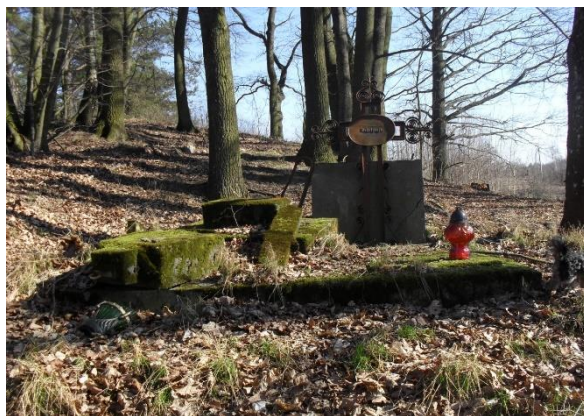
Rys. nr 4 Cmentarz Ewangelicki w Sąpach

Dziedzictwo Kulturowe Sąp stanowi krzyż i cmentarz Ewangelicki. Niegdyś na terenach parku znajdował się cmentarz właścicieli dworku, lecz groby zostały wykopane.