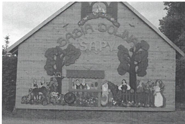
Rys. nr 5. Panoramiczny witacz wsi tematycznej Sapy „Babia Dolina”

Charakterystycznymi elementami naszej miejscowości są witacze - drewniane rzeźby Bab witające przyjezdnych. Największy z nich to panoramiczny witacz Wioski tematycznej Sapy Babia Dolina o powierzchni około 40m 2 , a także płaskorzeźby baby z numerami domów, zwyczajowe nazwy ulic.