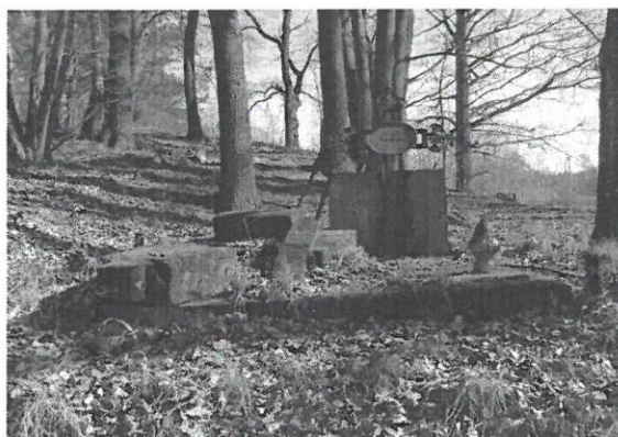
Rys. nr 4 Cmentarz Ewangelicki w Sąpach

Dziedzictwo Kulturowe Sąp stanowi krzyż i cmentarz Ewangelicki. Niegdyś na terenach parku znajdował się cmentarz właścicieli dworku, lecz groby zostały wykopane.