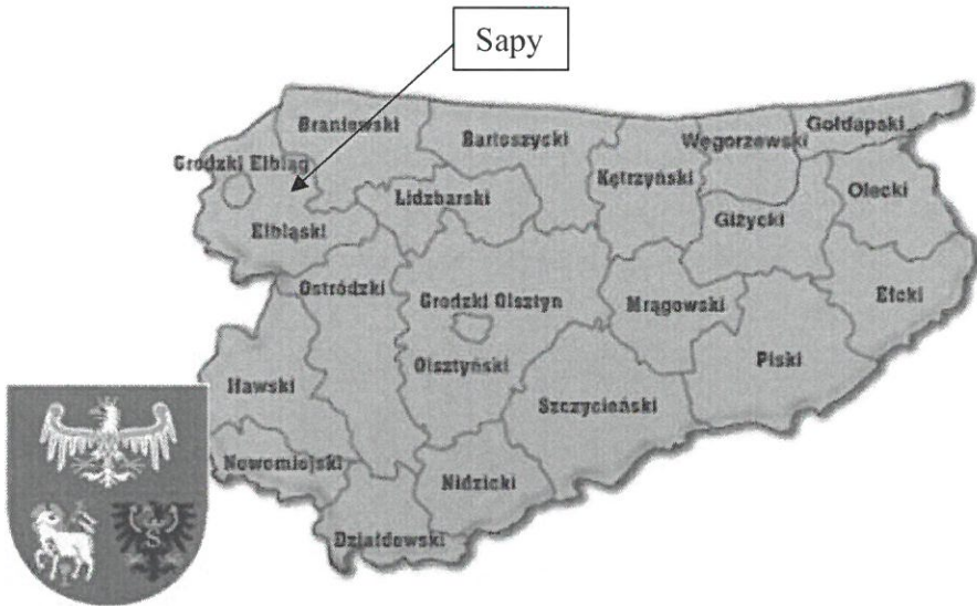
Rys. nr 2 Położenie Sap na mapie woj. warmińsko-mazurskiego.