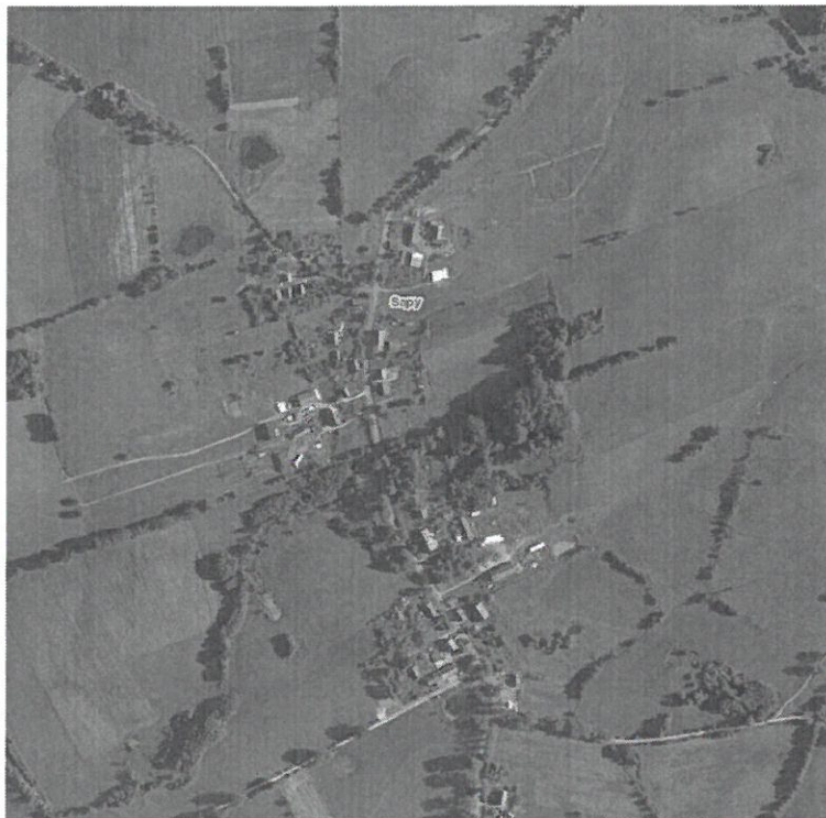
Rys. nr 4 Układ zabudowy w Sapach.

Układ zabudowy wsi Sapy nosi cechy typowej ulicówki. Jest to jednostronna, zwarta zabudowa ciągnąca się po obu stronach drogi wojewódzkiej nr 505. Wyjątkiem jest brak zabudowy w środku wsi, po obu stronach drogi, spowodowane to jest podmokłym terenem.